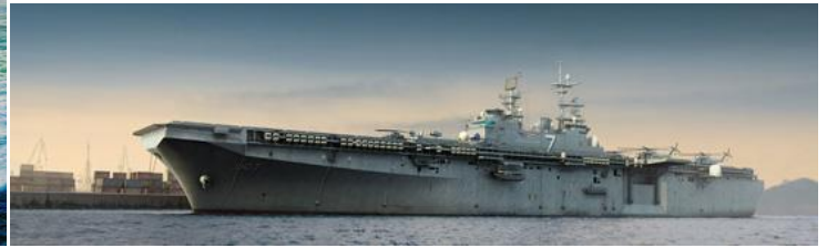
05611 1/350 アメリカ海軍強襲揚陸艦 LHD-1 ワズプ ¥24,800 (税抜価格)